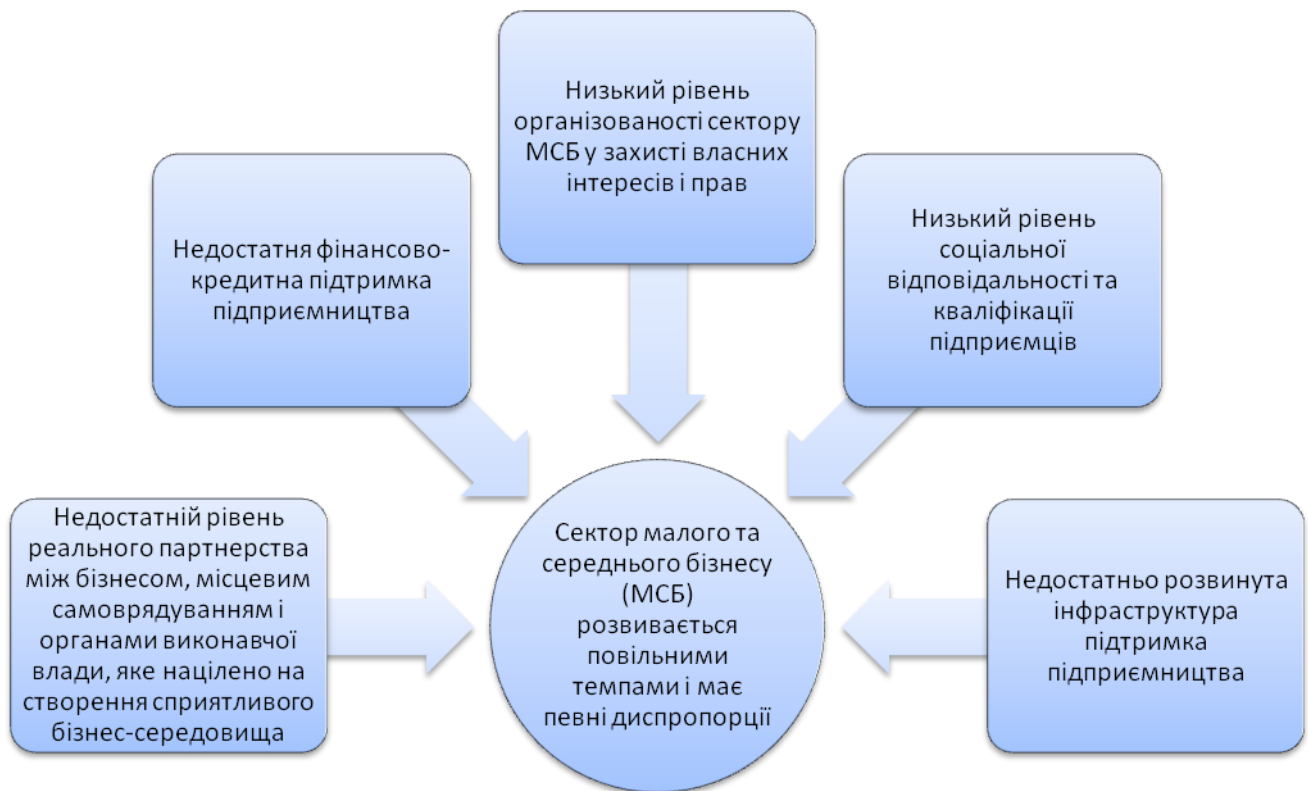
Рисунок 1 – Основна проблема розвитку сектору малого і середнього бізнесу та причини її виникнення

Наслідками такої тенденції розвитку сектору малого та середнього бізнесу є такі: